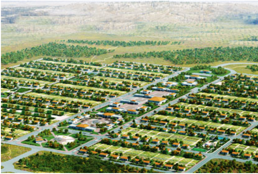
Comunidad Agroindustrial en la Zona de Fundo La Roana, estado Guárico